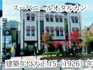
スーベニールオタルカン 建築年：大正15 (1926) 年