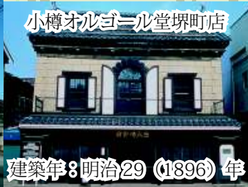
小樽オルゴール堂堺町店 建築年：明治29 (1896) 年