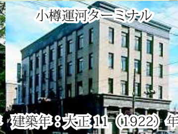
小樽運河ターミナル 建築年：大正11 (1922) 年