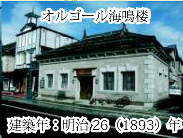
オルゴール海鳴楼 建築年：明治26 (1893) 年