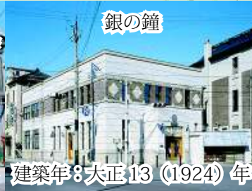
銀の鐘 建築年：大正13 (1924) 年