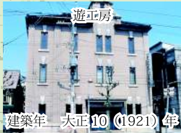
遊工房 建築年 大正10 (1921) 年