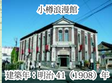
小樽浪漫館 建築年：明治41 (1908) 年