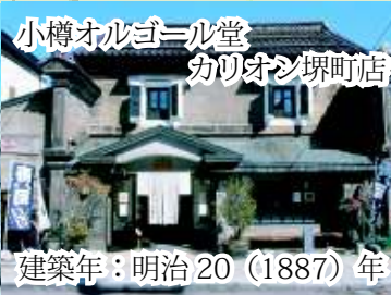
小樽オルゴール堂 カリオカソ堺町店 建築年：明治20 (1887) 年