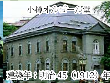
小樽オルゴール堂 建築年：明治45 (1912) 年